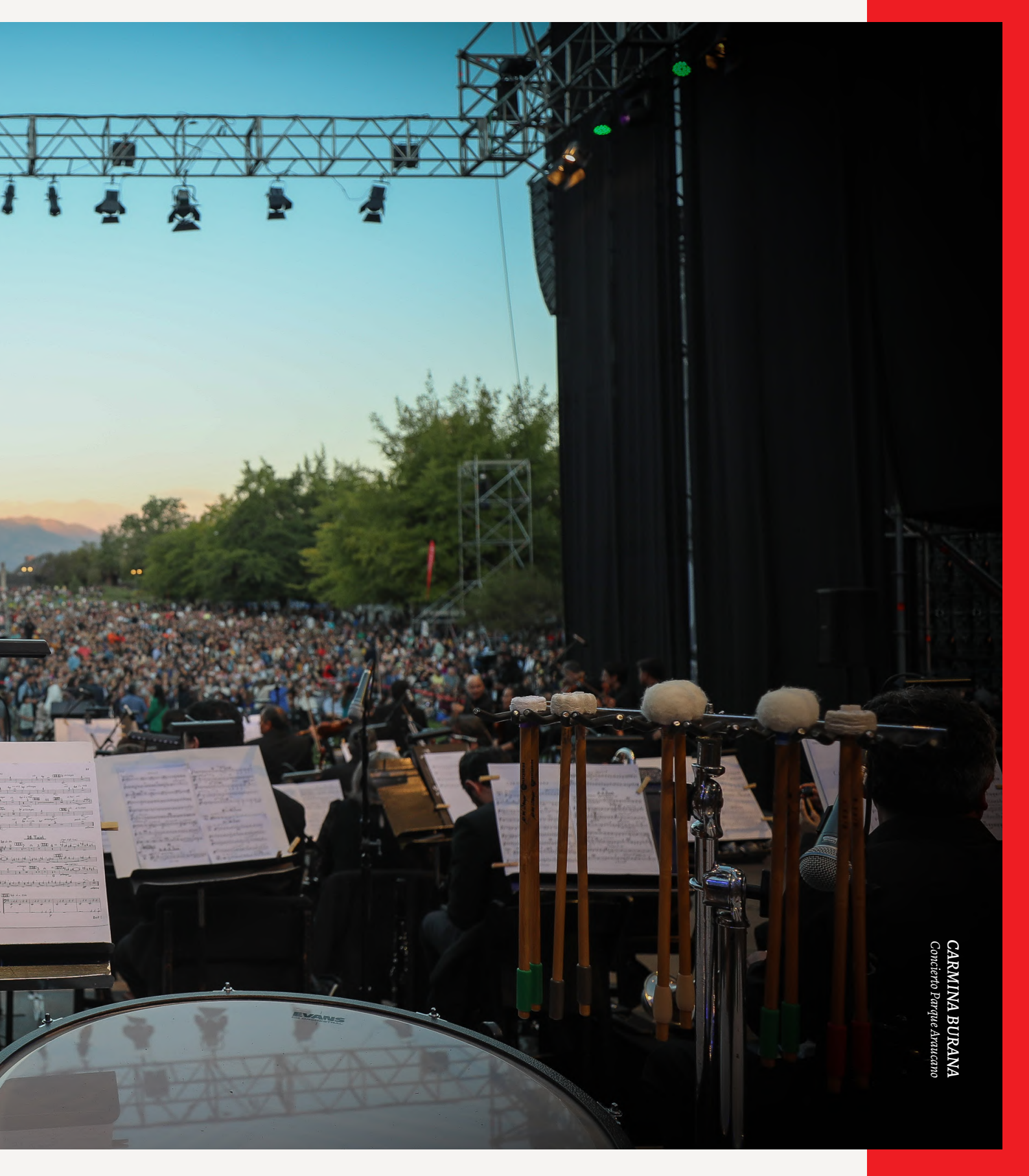
CARMINA BURANA Concierto Parque Araucano