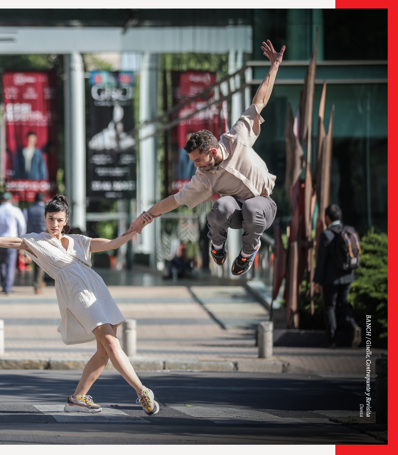
BANCH / Giselle, Contrapunto y Revisita Danza