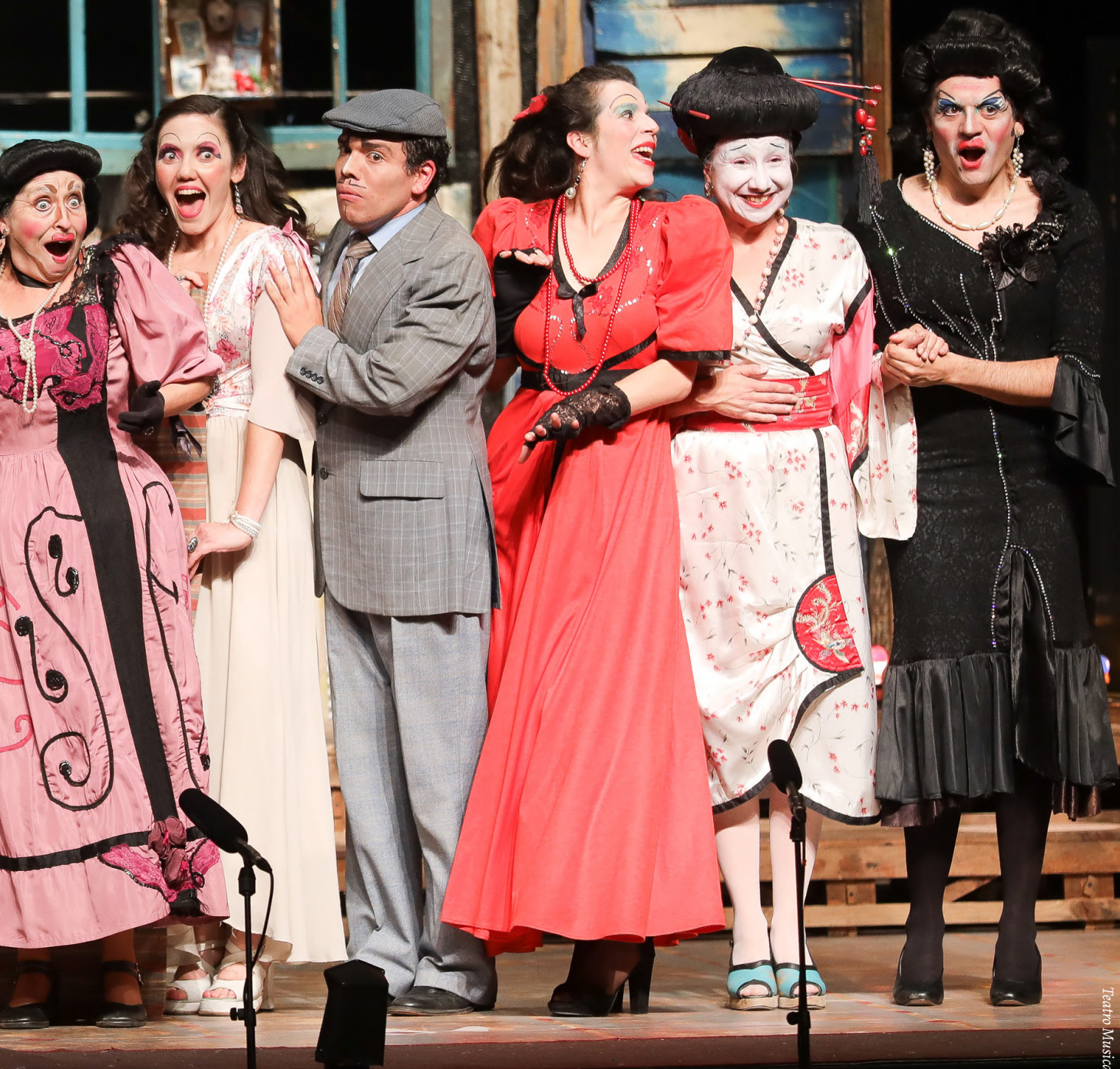
LA PÉRGOLA DE LAS FLORES Teatro Musical