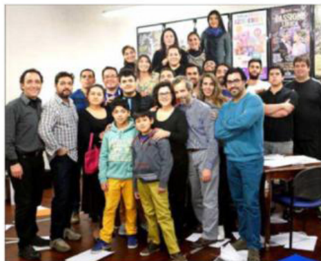
El elenco de esta ópera que se presentará desde el miércoles 25 en el Teatro Municipal de Las Condes. El título de Puccini no se daba en Chile desde 2003.

Con "Gianni Schicchi", de Puccini, esta dupla de reconocidos artistas regresa al Teatro Municipal de Las Condes, a partir del 25 de agosto. Serán seis funciones de esta ópera, con dos elencos de cantantes nacionales y precios accesibles. Al igual que en "Così fan tutte" y "Madama Butterfly", el objetivo es sumar nuevos públicos para el género lírico.