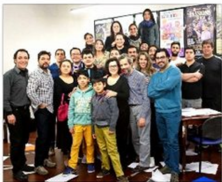
El elenco de esta ópera que se presentará desde el miércoles 25 en el Teatro Municipal de Las Condes. El título de Puccini no se daba en Chile desde 2003.

Con "Gianni Schicchi", de Puccini, esta dupla de reconocidos artistas regresa al Teatro Municipal de Las Condes, a partir del 25 de agosto. Serán seis funciones de esta ópera, con dos elencos de cantantes nacionales y precios accesibles. Al igual que en "Così fan tutte" y "Madama Butterfly", el objetivo es sumar nuevos públicos para el género lírico.