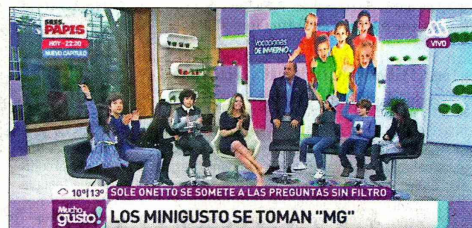
Sección "Minigusto" del matinal de Mega.